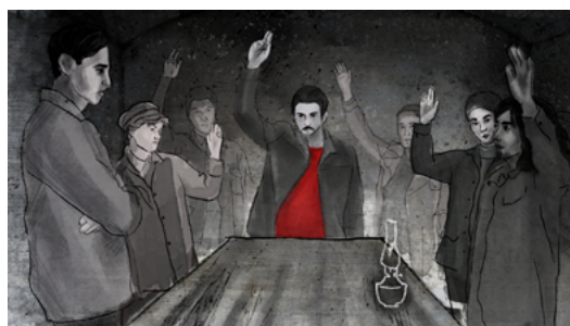
decyzja o podjęciu powstania