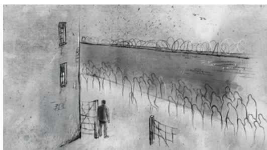
Wielka Akcja Likwidacyjna