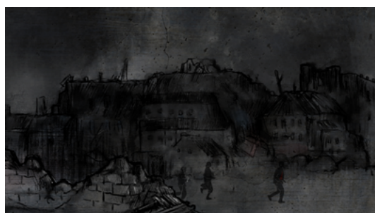
powstanie w getcie warszawskim