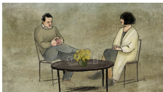
Żonkile otrzymywane co roku w rocznice powstania