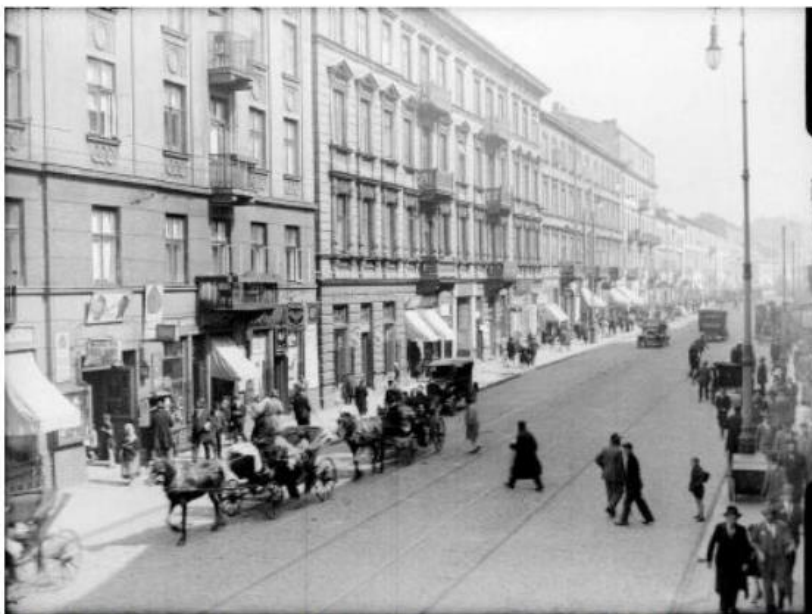
Ulica Nałewki przed 1939 r.

W Polsce przed II wojną światową mieszkało wielu Ukraińców, Żydów, Białorusinów, Niemców i osób innych narodowości. Na ulicach polskich miast z łatwością można było usłyszeć wiele różnych języków.