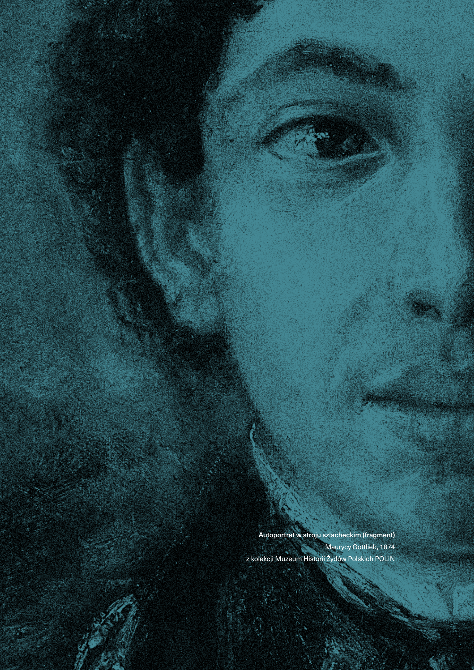
Autoportret w stroju szlacheckim (fragment) Maurycy Gottlieb, 1874 z kolekcji Muzeum Historii Żydów Polskich POLIN